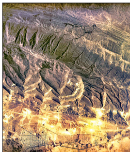
تصویر مربوط به خروج بوشهر ارسالی از ماهواره بر نور ۲ است

اینکه بپرسیم سینما صنعت است یا هنر، مثل این می‌ماند که سؤال کنیم گل سرخ خوشترنگ است یا خوشبو؟! یا گراز علفخوار است یا پستاندار؟! گل سرخ یا گراز فرقی نمی‌کند، وقتی سؤال ما از جنس «این یا آن» باشد، باید تضاد و تناقضی در میان باشد